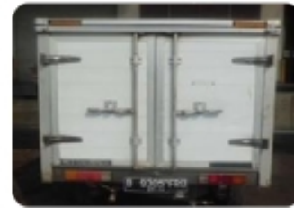
Close View - 1 Ton Truck