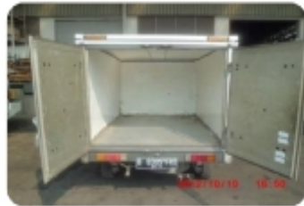
Open View - 1 Ton Truck