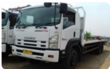
Los Tailgate Truck