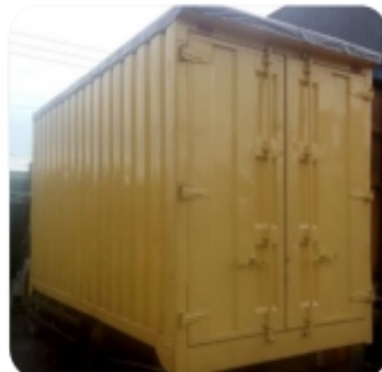
Back Side - CDE Truck