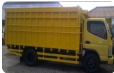
Back side - CDD truck