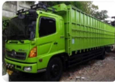
Back side opened wings box truck