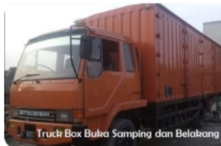
Left, Right and Back Opened Truck