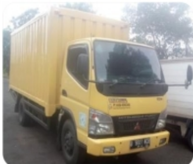
Front Side - CDE Truck