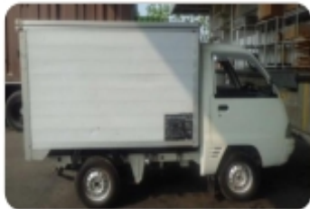
Side View - 1 Ton Truck