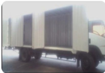
Left, Right and Back Opened Truck