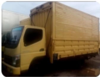
Left and Right - CDD truck