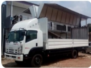
Left and Right opened wings box truck