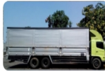
Long Wing Box