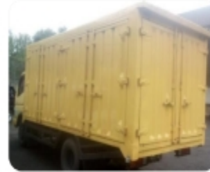
Left, Right and back side - CDD truck